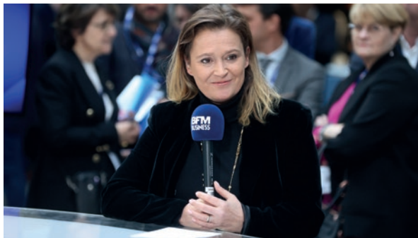
La ministre des PME Olivia Grégoire sur le plateau TV

Gabriel Attal , alors ministre de l'Éducation nationale, Olivia Grégoire , ministre déléguée chargée des PME, Carole Grandjean , ministre déléguée chargée de l'Enseignement supérieur et de la Formation professionnels et Agnès Firmin Le Bodo , ministre déléguée chargée de l'Organisation territoriale et des Professions de santé, sont également venus à la rencontre des chefs d'entreprise.