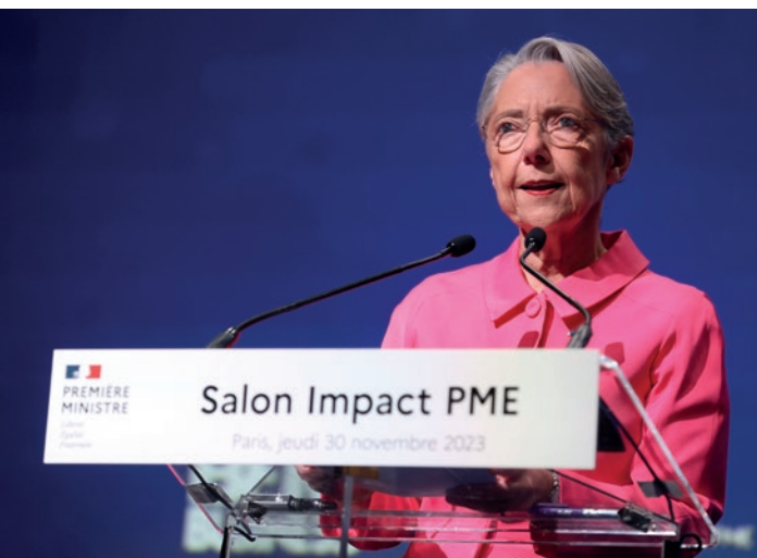
Discours d'ouverture de la Première ministre Elisabeth Borne

Élisabeth Borne a prononcé le discours d'ouverture du salon dans l'auditorium archi-plein de la Station F.